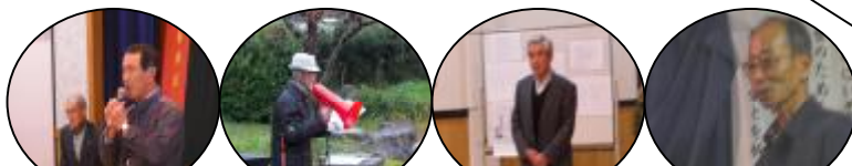
宮本館長・協力していただいた地域ボランティアの方々。