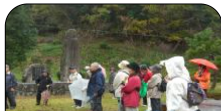
「抱月ふる里公園」にて説明!