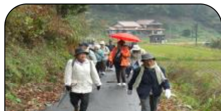
熊谷跡へ向かう黒沢御一行様!

島村抱月と須磨子の映画を見て、名前は知っています。こちらが生誕の町とは知らず、来させて頂きとても良かったです。