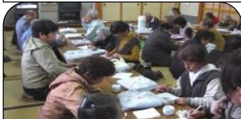
アンケートに協力して頂く皆さん。