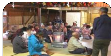
久佐八幡宮と抱月の由来を聞く