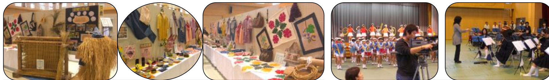
何人もの人が「懐かしい」の一言!