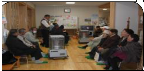
雪の降る寒い日でしたが、楽しかった