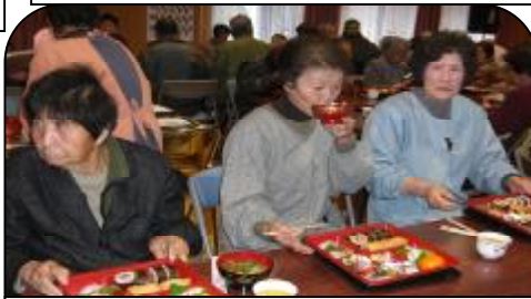
大衆演劇もお食事最高ですわ！