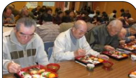
とてもおいしいお弁当でした！