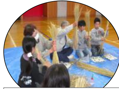
こうやってきれいにするの