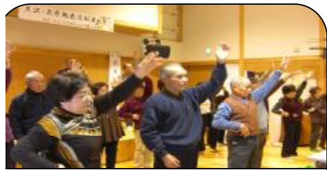
まめなくん体操で気合を入れて！