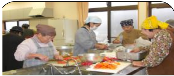
2日間お弁当作りありがとうございました

私たちは高齢者ですが、縁の下の力持ちです。まだまだ、現役で公民館の為に頑張っています。