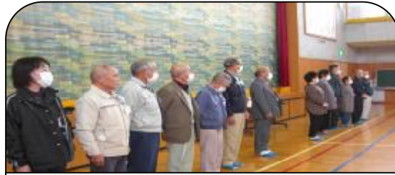
学校支援事業で、14名の方にしめ縄の指導をご協力いただきました。