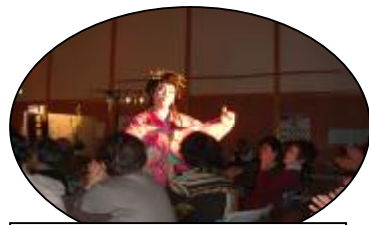
美月京太郎一座の場面