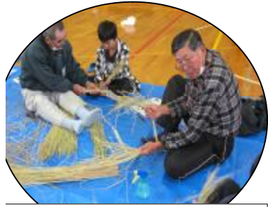
おっ。なかなかうまいぞ！