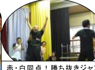
赤・白同点！勝ち抜きジャンケン ケンの末、赤組み勝利！