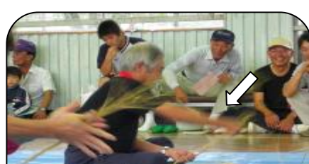
二人とも縄ないがうまいのう。熱い視線