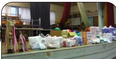
今年も豪華賞品だよ！皆さん頑張って！