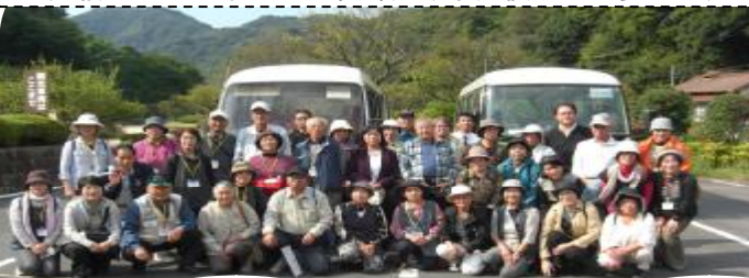
龍源寺間歩へ入ります！ドキドキ(銀を採掘した坑道)