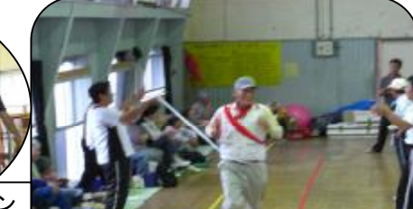
年齢別リレーで赤・白同点こりゃ大変！