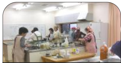
朝、5時集合！皆さん、ご苦労様♡ さあ、150食作るわよお～！！