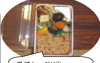
愛情たっぷり♡ 婦人会さんのお弁当