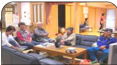
まあ、久しぶりじゃねえ！まめなかいね？