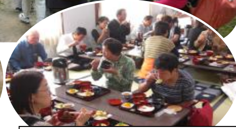
歩いた後はやっぱりこれだわ