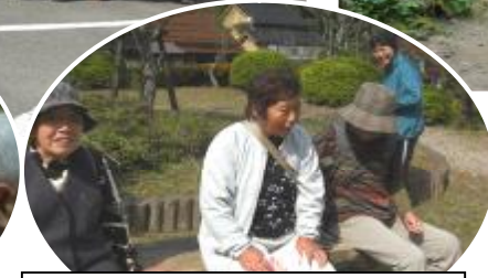
あ～くたびれた！足が棒？