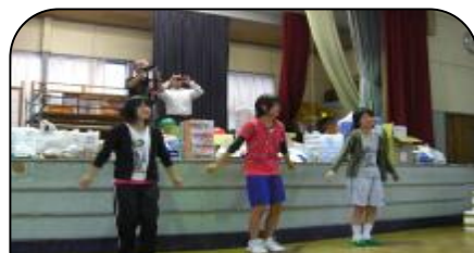
ラジオ体操は中学生のべっぴん娘