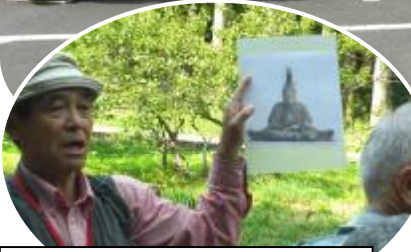
熱心なガイドさんの説明