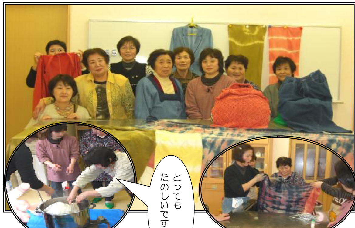
しっかりと液に浸けましょう！