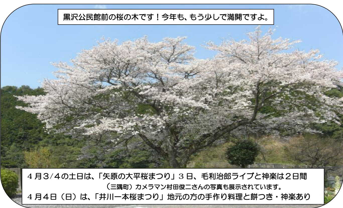
黒沢公民館前の桜の木です！今年も、もう少しで満開ですよ。

4月3/4の土日は、「矢原の大平桜まつり」3日、毛利治郎ライブと神楽は2日間(三隅町)カメラマン村田俊二さんの写真も展示されています。 4月4日(日)は、「井川一本桜まつり」地元の方の手作り料理と餅つき・神楽あり