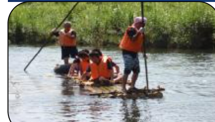
出発は、拍手に送られ絶好調！