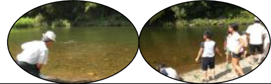
腕に自信あり！大人も子供も石の段飛ばし