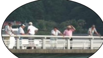
橋の上から応援団も大声援！