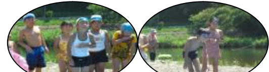
すいかの種飛ばしは、暑さの中に笑いあり！