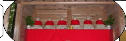
今日にはぎやかな一日でしたなあ