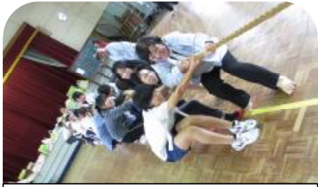
赤には負けられんよお〜! 勝った!