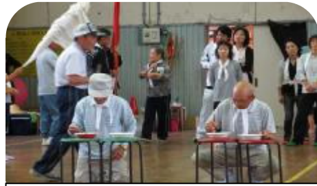
お2人とも真剣に豆運びに集中!