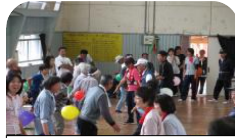
全員で風船割り。皆さん若返りました