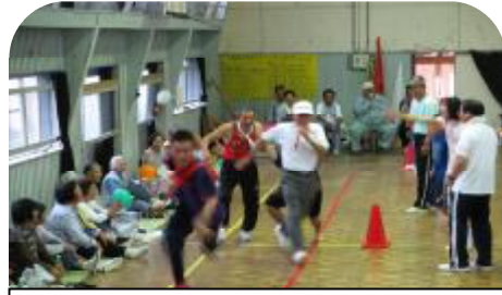
80代からバトン。アンカーは赤白団長