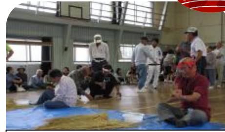
慣れた手つきで縄ない競争