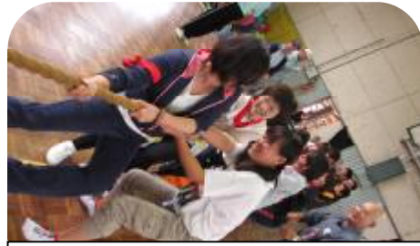
今年も白に勝つぞ〜。 よいしょ!