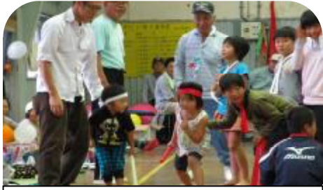
ぼくもわたしも頑張ってるよ!