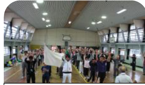
ご苦労様でした。バンザーイ!

9月21日浜田市交通安全協会三隅支部 黒沢分会主催「高齢者交通安全教室」が行われました 「高齢者交通安全教室」では、楽しく学べる交通ルールをしっかりと勉強しました。 「オレオレ詐欺」や「還付金詐欺」に気をつけるよう言われ、自転車やセニアカーの乗り方の指導も受けました。暗い夜道では、反射材を身に着けましょう!