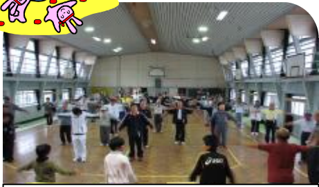
元気よく足腰伸ばしラジオ体操!