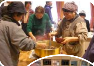
いっぱいあるけえ～ いっぱい食べてね☆