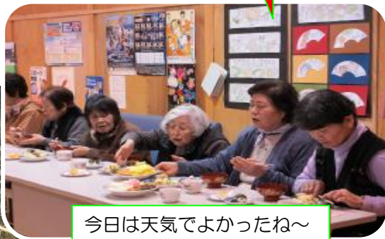
今日は天気でよかったね～