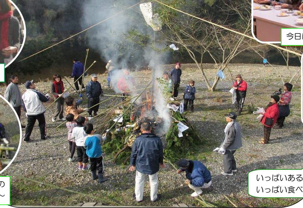
朝切ってきたばかりの竹はええ香りがするの～