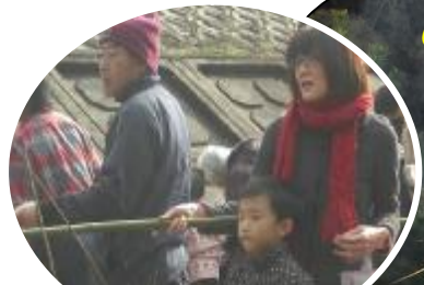
ほくも焼いてみる☆