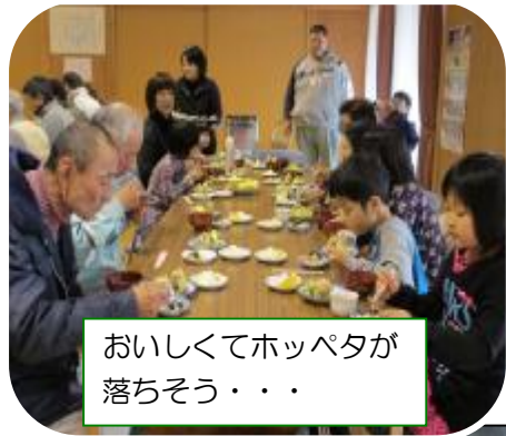
おいしくてホッペタが落ちそう・・・