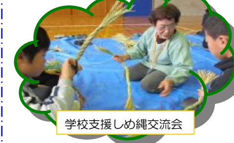
学校支援しめ縄交流会