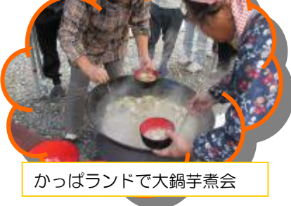
かっぱランドで大鍋芋煮会