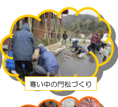
寒い中の門松づくり