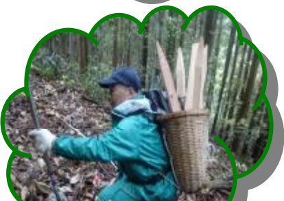
六地藏整備 測量中