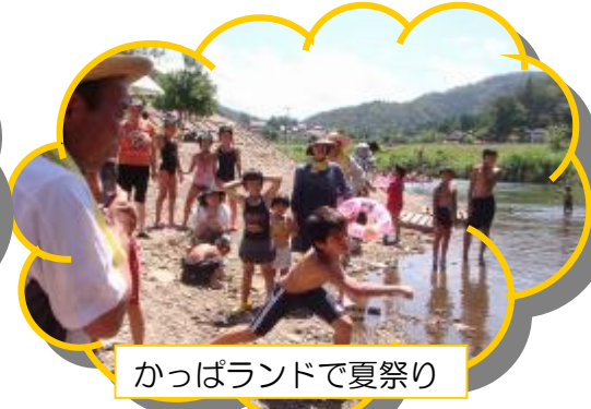
かっぱランドで夏祭り