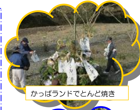
かっぱランドでとんど焼き