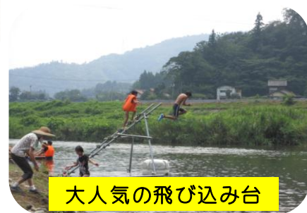
大人気の飛び込み台