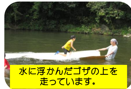
水に浮かんだゴザの上を走っています。

連日の暑さの中、好天気に恵まれ、第1部200名、第2部150名近くの方のご参加があり大盛況の中、夏の暑さを吹き飛ばすぐらいの水しぶきが上がっていました。