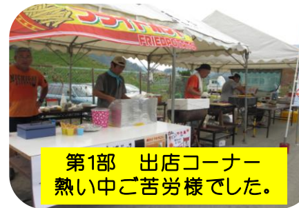
第1部 出店コーナー 暑い中ご苦労様でした。