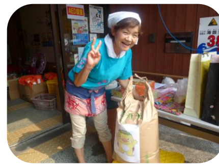
昨年お約束したうちの景品「30キロのお米」見事大当たり*