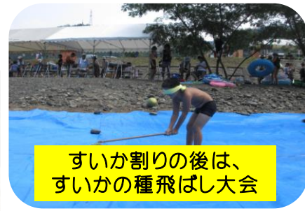
すいか割りの後は、すいかの種飛ばし大会