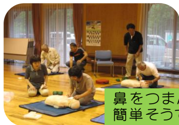
鼻をつまんで空気を吹き込むのは簡単そうととっても難しい!

黒沢婦人会さんを対象に数名の地域の方に... 和気あいあい和やかな雰囲気の中、真剣な眼差しで受講していただきました。ポデイを使い「心肺蘇生法」と、AEDの使い方をしっかりと学びました。