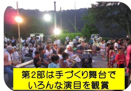
第2部は手づくり舞台でいろんな演目を観賞