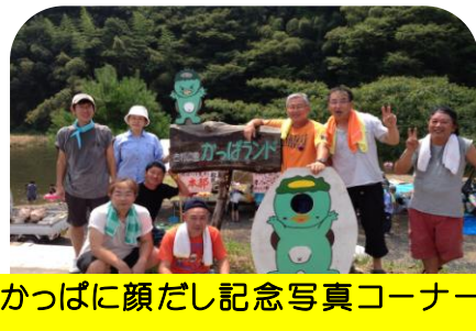
かつぱに顔だし記念写真コーナー