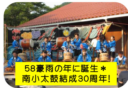
58豪雨の年に誕生 * 南小太鼓結成30周年!