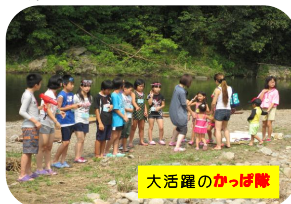
大活躍のかつぱ隊