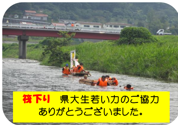
筏下り 県大生若い力のご協力ありがとうございました。