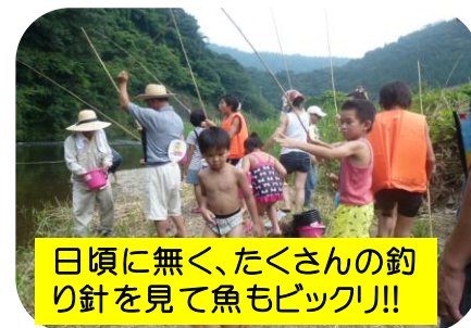
日頃に無く、たくさんの釣り針を見て魚もビックリ!!