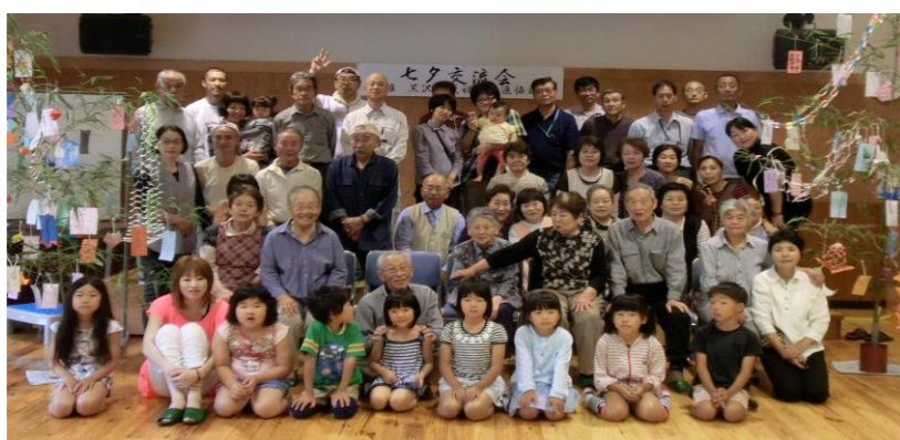
笑顔がいっぱいの交流会！！