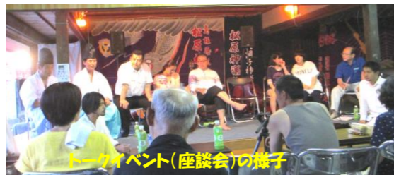
トークイベント(座談会)の様子