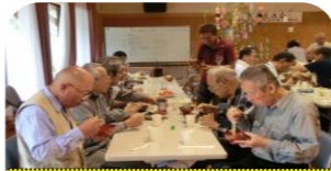
早朝より福祉委員さん手作りのバイキングで昼食会！