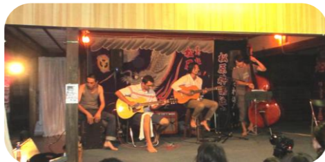
優しい音色と歌声。コンサート風景