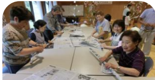
個性がひかる輪っか作り

いつものゲーム機や市販品のおもちゃとは、一味違う形の「あ・そ・び」と人生の大先輩がたとの交流で、教えを乞う事もたくさんあり、新鮮な感覚をいっぱい味わって頂けたのではないのでしょうか。