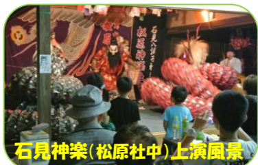
石見神楽(松原社中)上演風景

コンサート・石見神楽と進み、終了後家路に着く地域の年配の方々が、「まあ近くでええもんを見せてもらってよかったね〜。」「迫力があってとっても良かったね〜。」と、笑顔で話されている様子を拝見して、この日開催された事に対する貴重な賛辞のように思えました。