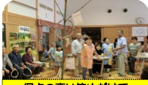
得点の高い笹めがけて輪投げは1人2回まで・・・