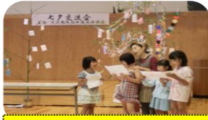
初挑戦の昭和の歌を大合唱