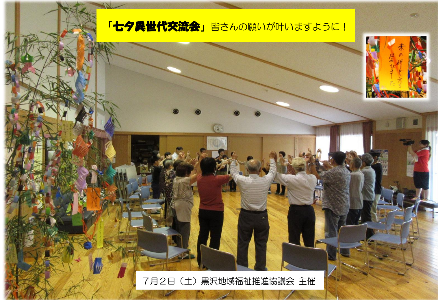
7月2日(土) 黒沢地域福祉推進協議会 主催