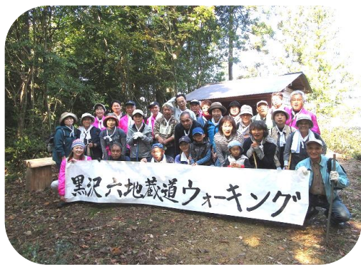
各自の歩くペースに合わせてウォーキング!