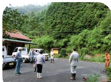
部長さんから朝のご挨拶