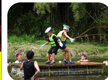
ペットボトル筏おしり相撲