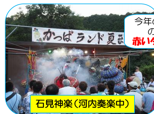
石見神楽(河内奏楽中)