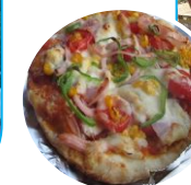
今年初の試みピザ窯で本格ピザを焼きました。