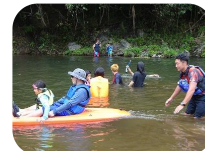
三隅 B&G の方にカヌー体験を開いて頂きました