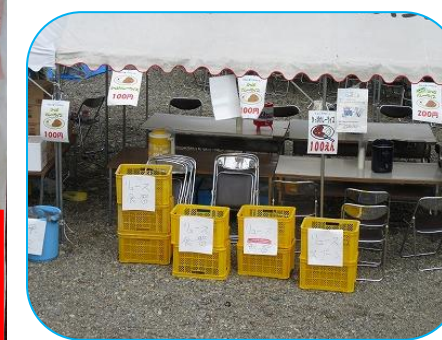
今年もかっぱカレーは リユース食器 を活用しました。調理班の皆さま美味しいカレーをありがとうございました。