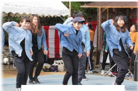
県立大学 ダンスクラブ