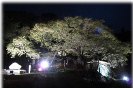
LEDのライトアップで、とても綺麗でした