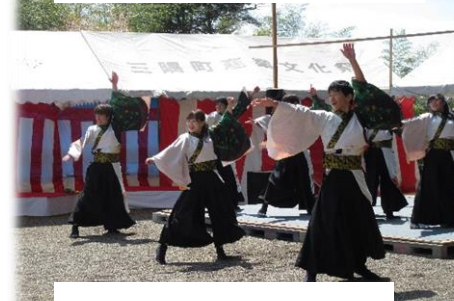
県立大学 よさこい橙蘭