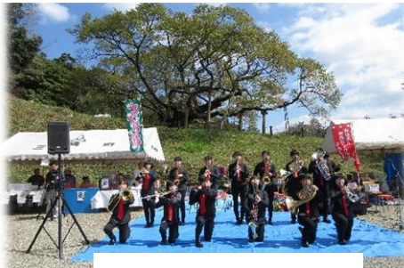
益田東中学校吹奏楽