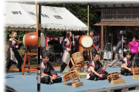
南小太鼓 有志のみなさん