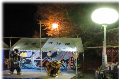
バルーン式照明のもとでの河内演奏中