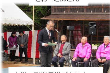
大学の副学長様ごあいさつ