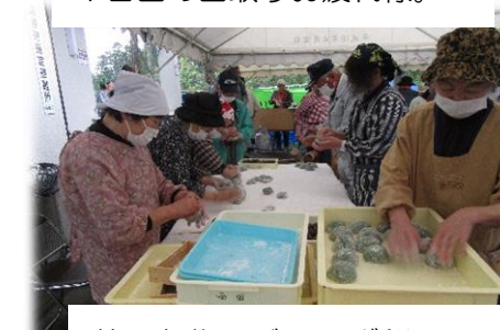
井川名物のジャンボ餅