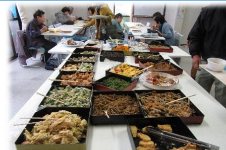
地産地消にこだわった田舎料理の数々