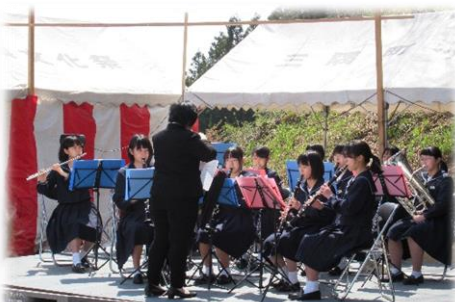
三隅中学校吹奏楽部