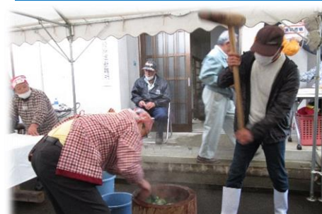
12日の臼取りお疲れ様。