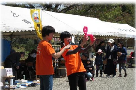
県立大学 大道芸部