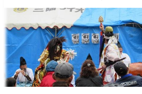
雨模様の中でも盛り上げていただきました。

小雨が降る中で行なわれた「井川の一本桜まつり」。その後曇り空に変わり多くの人で賑わいました。雨の為、会場がいた石見神楽もたくさんの方に観ていただきました。一番人気の杵つき餅は、早くから行列ができ、出来上がったあんこ餅はビッグサイズ。一つ食べればお腹いっぱいになりそうなサイズに仕上がっていました。恒例の田舎料理も大人気の行列でした。井川集落の方々、桜まつりに参加されたみなさん、本当にお疲れ様でした。