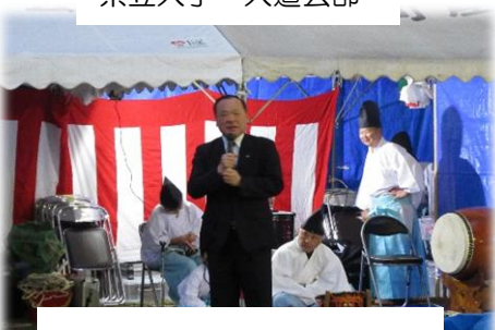
大屋議長様のごあいさつ