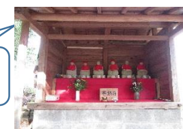
きれいになった六地藏さん

11月9日(金)「はつらつ健康教室」のみなさんに、花壇の手入れをしていただきました。いつも公民館美化活動にご尽力をいただき、大変感謝しています。花壇もきれいになり喜んで見えます。寒い中での作業、ありがとうございました。これからも公民館活動にお力添えをお願い申し上げます。