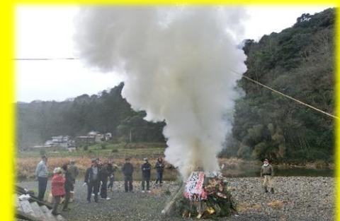
今年も良いことありますように！