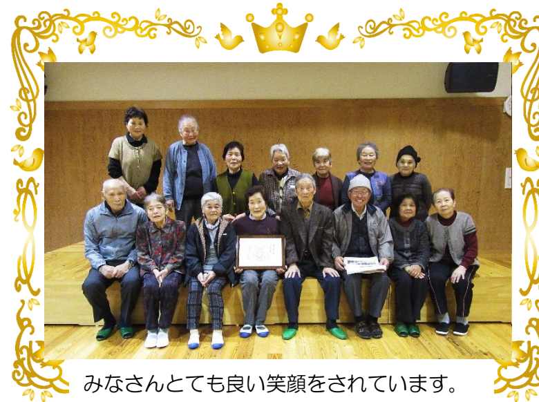
みなさんととても良い笑顔をされています。

「はつらつ健康教室」のみなさんが、浜田圏域健康長寿しまね推進委員会より、圏域会長賞を受賞されました。 日頃から健康づくりに積極的に取り組まれているみなさんの活動が、島根県一をめざした健康づくりの県民運動の模範として認められたものです。 受賞おめでとうござります。