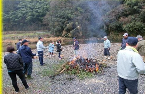
とんど焼き行事でお餅を食べると、この一年が健康で暮らせるそうです。ごちそうさまです。