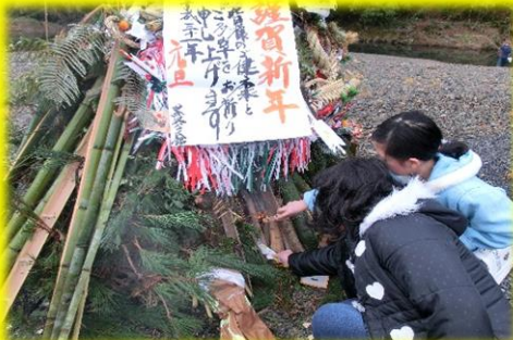
小学生2人よる神聖なる着火にドキドキ。

朝は、心配していた雨もあがり、今年はたくさんの正月飾りが集まりました。10時には元気な小学生2人の点火で始まり、まっすぐに天高く上がった煙りは青竹の爆ぜる大きな音とともに、今年一年の災いを吹き飛ばしたようでした。また、みなさんと一緒にとんどで焼いたお餅は小さいお子さんからお年寄りまで大人気でした。今年一年、皆さまにとりまして幸多き年になります様「無病息災」を願いながらお餅をいただきました。