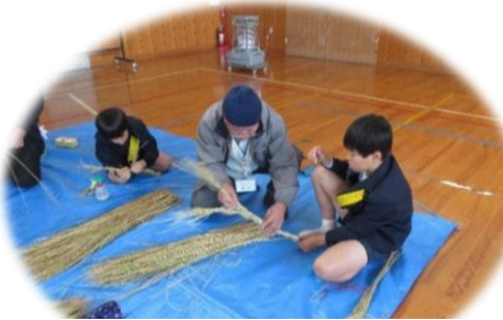
こうやってねじるんだよ。

しめかざりの作り方を教えていただきありがとうございます。作ったしめかざりは、自分の家とおじいちゃんの家にかざろうと思います。本当にありがとうございました。