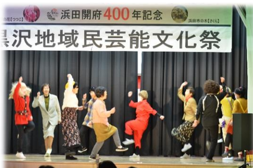
黒沢婦人会、盆踊り「ダンシングヒーロー」。