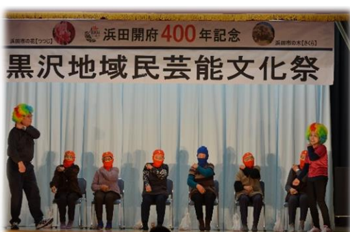
矢原遊々サロンのみなさん。 まだまだ舞台上がれますヨ。