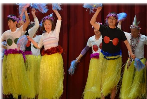
ロック座 最後は賑やかにタヒチアンダンス！