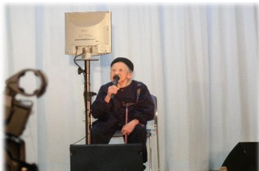
カラオケスター誕生。89歳のおばあちゃん！