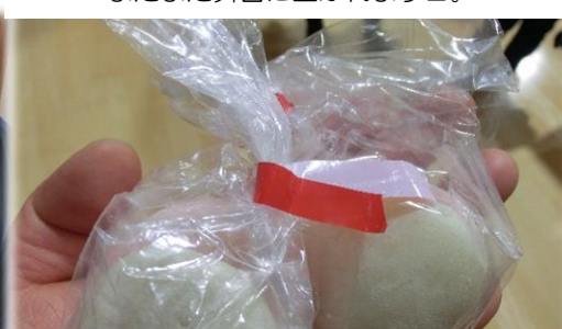
今年は記念が沢山重なりました。最後におめで たい紅白の餅を配りました。