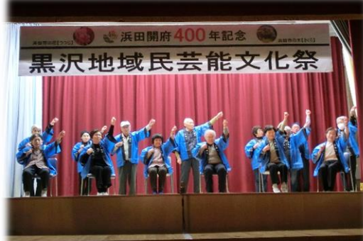
はつらつ健康教室の皆さんの元気体操！