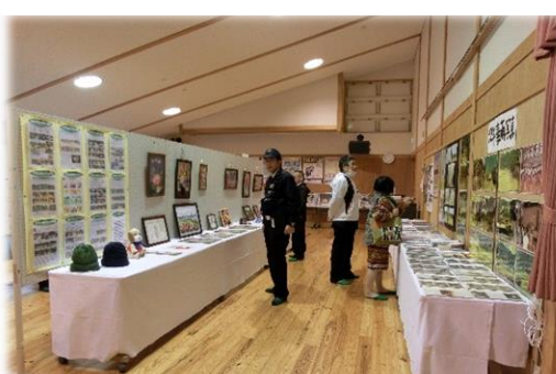
地域の皆さんの作品や活動の様子を展示しました。