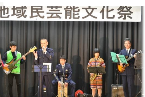
はまだ劇団SCOP（浜田警察署） 「振り込め詐欺の演歌で、注意喚起」