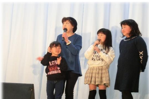
子ども達と一緒に「タッチ」熱唱。楽しいね。