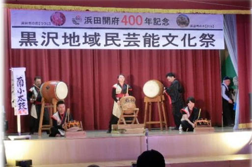
オープニングは南小太鼓で。