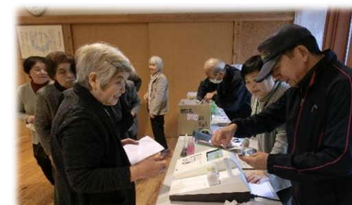
小ホールでいりこのつかみ取りと 骨密度のチェック。