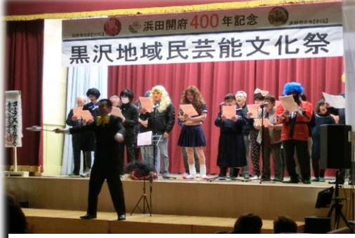
黒沢7区のコーラス、 仮装がバッチリ決まっています。