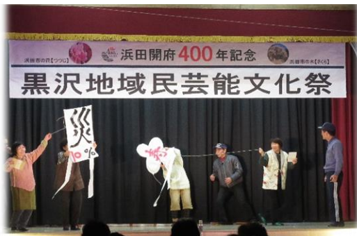
黒沢4区は、昔の遊びで登場。