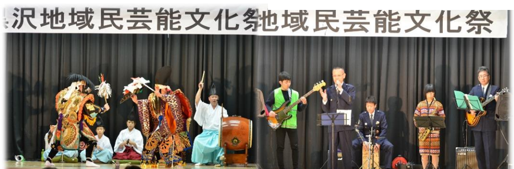
河内奏楽中の石見神楽「頼政」