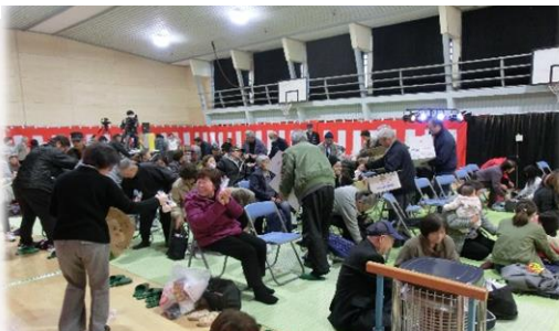
紅白餅を手に笑顔で再会を約束。