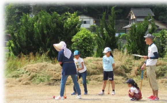
一打入魂！熱い視線で応援です。