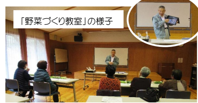
「野菜づくり教室」の様子

畑仕事には日和の良い天気でしたが、この日はかりはみなさんちょっと身体を休めて「春夏野菜づくり教室」に参加されました。これからの畑づくりで準備しておくことや、種物を蒔く時に注意することをタブレットを使われながらわかりやすく説明されました。次回の教室は「秋冬野菜作り教室」です。7月を予定しています。